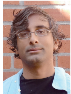
数論的部分群のコホモロジーと保型 形式の周期 "Cohomology of Arithmetic Groups and Periods of Automorphic Forms"