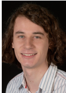
局所対称多様体のコホモロジーの ねじれ部分について "On Torsion in the Cohomology of Locally Symmetric Varieties"

C. Manolescu (University of California, Los Angeles)