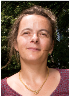
ランダム行列と自由解析 "Random Matrices and Free Analysis"

A. Guionnet (Massachusetts Institute of Technology)