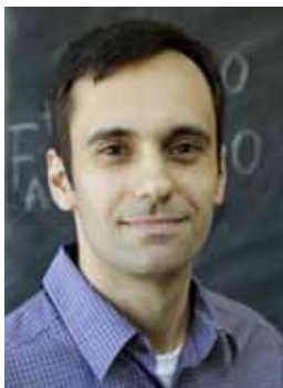
フレア理論とトポロジーへの応用 "Flour Theory and Its Topological Applications"

A. Guionnet (Massachusetts Institute of Technology)