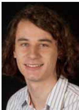
局所対称多様体のコホモロジーの ねじれ部分について "On Torsion in the Cohomology of Locally Symmetric Varieties"

C. Manolescu (University of California, Los Angeles)