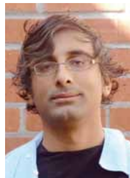
数論的部分群のコホモロジーと保型 形式の周期 "Cohomology of Arithmetic Groups and Periods of Automorphic Forms"