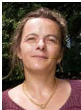
ランダム行列と自由解析 "Random Matrices and Free Analysis"