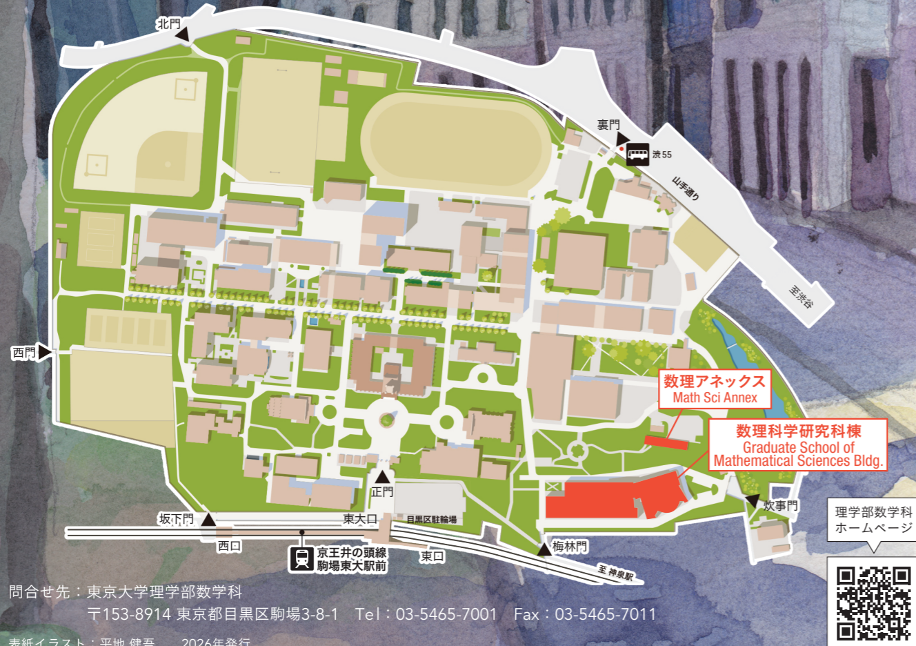
駒場Iキャンパス配置図 (2023.4現在) Komaba I CAMPUS MAP