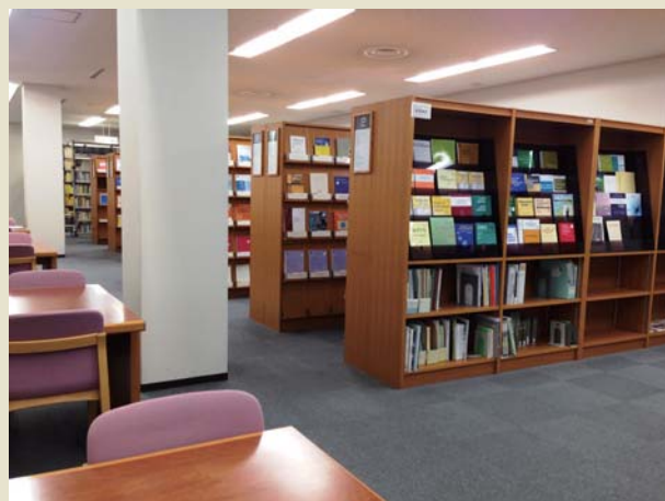
新着雑誌架と閲覧席（1階）