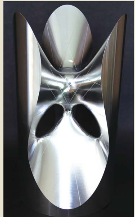
3次曲面上の27本の直線