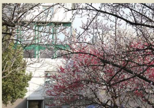
梅林より研究科棟をのぞむ

大学院数理科学研究科では、2019年度より「数物フロンティア国際卓越大学院」を発足させました。このプログラムでは、数学を軸とし諸科学に広がりを持つ研究領域の開拓および数学の理論を深化、創成し異分野連携ができる次世代の数学・数理科学のリーダーの養成を目指します。また、文部科学省の卓越大学院プログラム（WISE Program）に令和元年度採択された「変革を駆動する先端物理・数学プログラム（FoPM）」では、連携部局として協力しています。FoPMは、5年間の修士博士一貫プログラムで、基礎科学の専門人材に、科学技術や社会イノベーションに広く影響を与えるためのスキルを提供することで、彼らのポテンシャルを最大化するプログラムです。