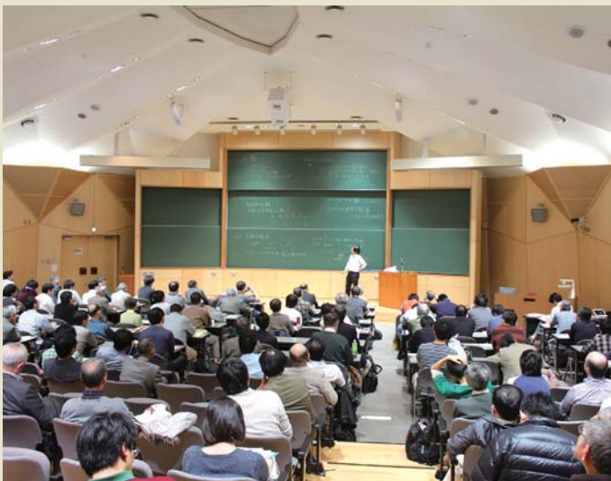
大講義室における公開講座

数理・データサイエンス分野に関する基礎的知識と技術を身につけるための部局横断型教育プログラムです。このプログラムの理学部開講科目には「統計データ解析Ⅰ、Ⅱ」、「確率統計学基礎」、「Pythonプログラミング入門」などがあります。