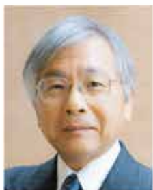
二木 昭人 教授

2012 年 10 月に東京工業大学から異動して参りましたが、5 年 6 ヶ月の在籍で 2018 年 3 月に退職することになりました。着任時点で定年まで 7 年 6 ヶ月でしたので、短期決戦で臨むつもりで定年まで精一杯頑張ろうと思っておりましたが、定年まで 2 年残しての早期退職となりました。退職後は中国、清華大学の丘成桐数学科学中心 (Yau Mathematical Sciences Center) でお世話になります。