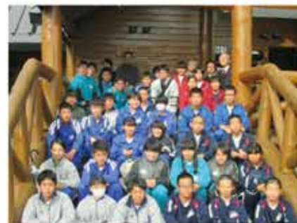
中学生のための数学教室での集合写真

毎年行われている2年生を対象とした「進学予定者のためのオリエンテーション」は10月14日、15日の一泊2日の日程で行われました。今年もオリエンテーションの参加者は多く、同伴された4学期担当の教員は一部ペンション村に宿泊するなどに対応しました。