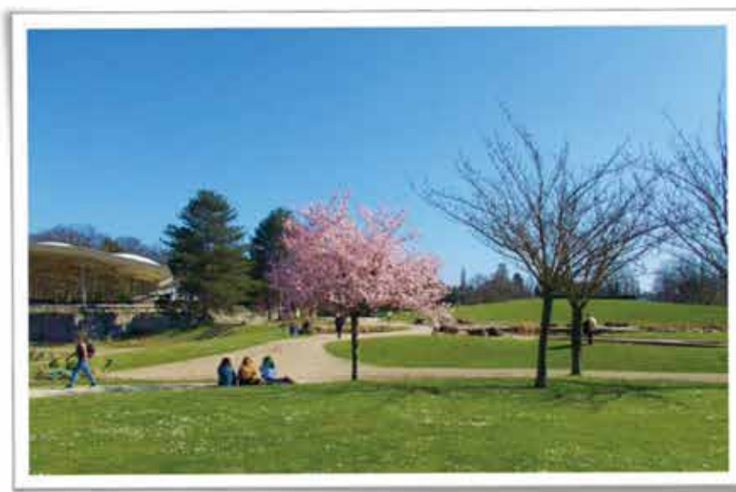
Parc Floral de Paris