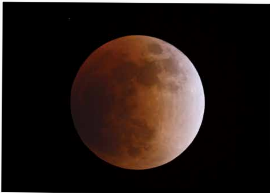
皆既月食 2018.1.31