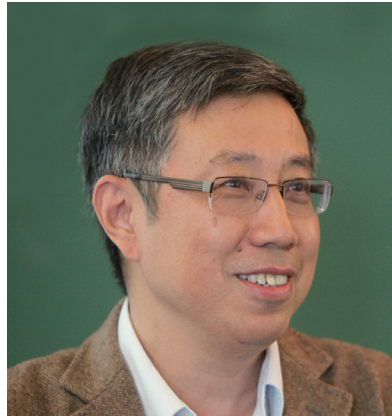
ケーラー・アインシュタイン計量とファノ多様体 "Kähler-Einstein Metrics on Fano Manifolds"