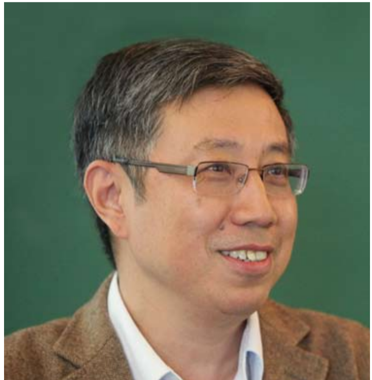
ケーラー・アインシュタイン計量とファノ多様体 "Kähler-Einstein Metrics on Fano Manifolds"