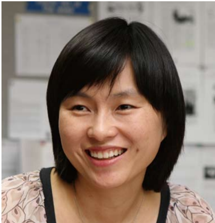
アポロニウスの球充填:力学系と整数論 "Apollonian Circle Packings: Dynamics and Number Theory"